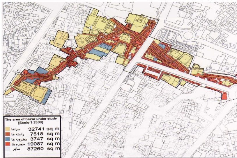
نقشه ۲: بازار قدیمی که توسط سه خیابان از هم جدا شده است