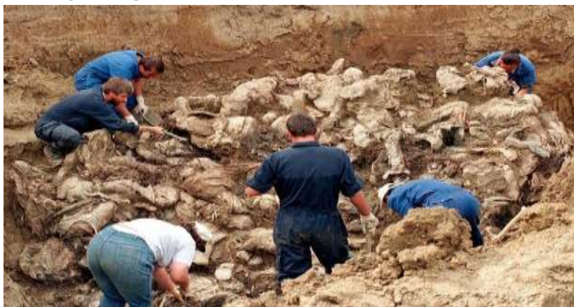
تصویر ۱: باستان‌شناسان در حال کار در سایت گور دسته‌جمعی در بوسنی

روش‌های مختلف باستان‌شناختی به منظور گردآوری اجساد سود جست و نتایج موفقیت‌آمیزی را به دست آورد.