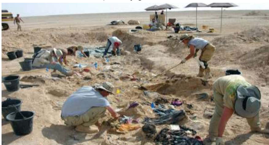
تصویر ۲: گورهای دسته‌جمعی واقع در کردستان عراق مربوط به کشته‌شدگان قومیتی در جریان عملیات انفال توسط صدام