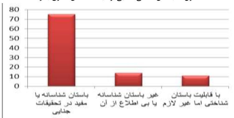
جدول ۳: باستان‌شناسی جنایی از دیدگاه فعالان حقوق بشر

نتایج به‌دست‌آمده از پرسشنامه‌های پرشده توسط سه گروه جامعه آماری به این ترتیب قابل مقایسه است.