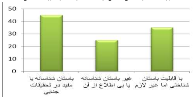
جدول ۲: باستان‌شناسی جنایی از دیدگاه کارشناسان نیروی انتظامی

دسته سوم از مصاحبه‌شوندگان یعنی کارشناسان حقوق بشر، برخلاف دو گروه دیگر آگاهی بیشتری نسبت به باستان‌شناسی جنایی و فعالیت‌های آن در دهه‌های اخیر داشتند و معتقد بودند با به‌کارگیری باستان‌شناسی بیشتر از هر رشته‌ای می‌توان به بازیابی بقایای مربوط به جنایت‌های روی داده کمک کرد. ۷۵ درصد جمعیت گروه چنین نگرشی داشتند. از ۲۵ درصد باقی‌مانده ۱۴ درصد از باستان‌شناسی جنایی اطلاع چندانی نداشتند و ۱۱ درصد عملکرد باستان‌شناسی در تحقیقات جنایی را با وجود جرم‌شناسان مجرب بی‌مورد دانستند.