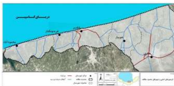
تصویر ۱: موقعیت مکانی محدودهٔ مورد مطالعه

ناحیهٔ مورد مطالعه در این پژوهش پنج شهرستان ساحلی ساری، جویبار، بابلسر، فریدون‌کنار و محمودآباد، در استان مازندران را شامل می‌شود که به ترتیب ۲۱/۸، ۱۵/۵، ۲۷، ۸ و ۸ کیلومتر نوارساحلی دارند. نواحی پیراشهری شامل زمین‌های واقع در محدودهٔ حریم شهرها، نواحی روستایی و زمین‌های خارج از محدودهٔ قانونی روستا و حریم شهرها می‌شود. سه عنصر کالبدی اصلی در این محدوده نقش ایفا می‌کنند که شامل کریدور شرق به غرب، سکونتگاه‌های واقع در جنوب کریدور و اجتماعات دروازه‌ای در شمال کریدور هستند. در این پژوهش، فضاهای انحصاری در قالب اجتماعات دروازه‌ای هم در جنوب و هم در شمال کریدور نام برده مدنظر است (تصویر ۱).