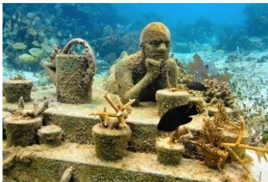
شکل ۵ و ۶. موزه زیر آب، مجموعه رویاها، ۲۰۱۳.

دنیای واقعی است و به شی‌وارگی انسان برای تخریب انسان و طبیعت تأکید شده است. ساختار مجسمه‌های تیلور با خصیصه‌های واقعی انسانی «خودبیگانگی انسان در دوره معاصر» مشابه است. در این آثار انسان به مثابه شی به کار رفته است و رابطه میان انسان‌ها به رابطه میان اشیا بدل شده است. انسان در حد یک شی یا کالا در ساختار جامعه معاصر تلقی می‌شود. تکراری و هم شکل بودن انسان‌ها بر این امر تأکید دارد. یکی از مهم‌ترین ویژگی‌های انسان‌های تیلور به عنوان برساختی از اجتماع و یک سوژه مدرن بدون هویت است که به شی‌وارگی رسیده است. انسان به صورت یک کالای سرمایه‌داری جایگاهی همانند شی پیدا کرده است. در آثار او مرز بین واقعیت انسان معاصر و انسان به مثابه یک کالا یا شی مطرح شده است. انسان در این آثار دچار جدا شدن از واقعیت و عدم درک آن شده و انسان را به عنوان یک شی واره طبیعی نشان می‌دهد که معنای ثانوی طبیعت را باز می‌تاباند. انسان در این آثار به صورت فراواقعیت یا واقعیت حاد با تأثیر پذیری از نشانه‌های فلسفه پست‌مدرن تصویر شده است تا عدم توانایی انسان در مرز بین واقعیت و خیال را نشان دهد. در فرهنگ پست‌مدرن فراواقعیت مفهومی برای تفسیر انسان است که باید واقعیت‌های گوناگون استفاده کند و جهان معاصر را کشف و درک کند. انسان در آثار تیلور دچار خودبیگانگی، تنهایی، گسست انسان معاصر است که با نظریات بودریار در مورد پسامدرن تطبیق دارد.