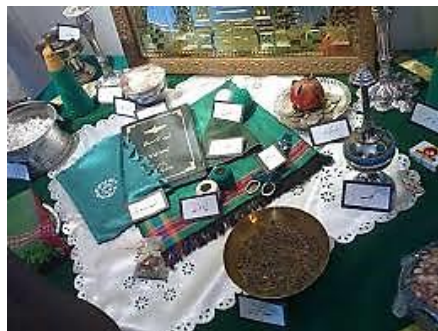
شکل ۳. سفره گواه‌گیران زرتشتی، وجود سوزن و نخ سفید و سبز