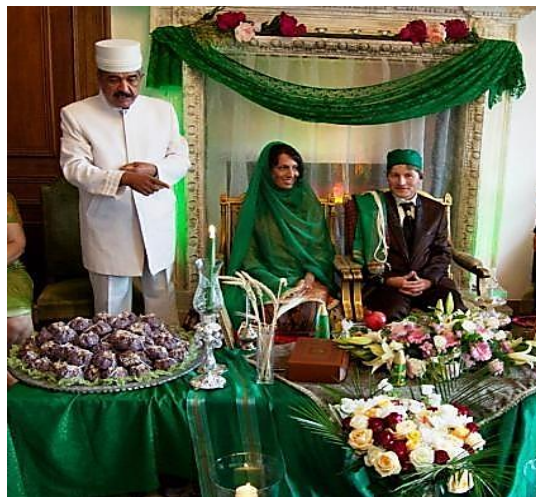
شکل ۱. پوشش لباس عروسی بانوان زرتشتی یزد

زمین) ماه آخر تقویم؛ بنابراین می‌توان نتیجه گرفت که ابتدا ناهید (دوشیزه) در پیوند با ایزد مهر، مسبب سبزی و باروری زمین (سپندامذ) شده است. ۱ رنگ سفید و سبز در میان ارکان سفره عقد/ گواه‌گیران حضور نمادین دارد. به عقیده زرتشتیان، دوشیزه پاکدامن با نماد رنگ سفید به مقام همسری و زنانگی نائل شده (ایوزیان، ۱۳۸۸: ۴) و در این سیر تحول، رنگ سفید باکرگی به سبز زنانه بدل می‌شود. همچون ایزدبانوی دوشیزه آب/ ناهید در تبدیل به ایزدبانوی مادرانه زمین/ سپندامذ امشاسپند. چنان‌که در عروسی سنتی یزد، لباس عروسان ۲ زرتشتی، سر تا پا سبز بوده است (نیکنام، ۱۳۸۱: ۶۴) (شکل ۱). البته عروس، یک روز قبل از مراسم جشن عروسی، لباس سفید ۳ بر تن می‌کند و برای دیدار داماد حاضر می‌شود.