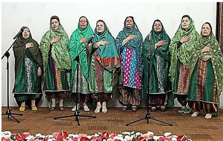
شکل ۴. استفاده از پوشش مکنای سبز در روز جشن سپندارمذ/ روز زن توسط بانوان زرتشتی

براساس معتقدات زرتشتیان، تبار ایرانی بی‌بی شهربانو و ازدواج وی با امام حسین (ع)، سبب اشتراکات بسیار شده است که یکی از آن‌ها قداست رنگ سبز و قراردادن پوشش سر (مکنا) در میان بانوان زرتشتی، به نشان از همسر امام حسین (ع) و بی‌بی شهربانوست. مکنای سبز رنگ در ادبیات شفاهی زرتشتیان و ضرب‌المثل‌های دری بهدینی نیز همتایی دارد. از آنجا که مثل‌ها نوعی رده‌شناسی خاص از الگوهای تفکر میان اعضای یک جامعه محسوب می‌شوند که با استفاده از آن می‌توان بسیاری از ایده‌های آن جامعه را دریافت و به چگونگی افکار ایشان پی برد، مفاهیم درک و پدیده‌های جهان از دیدگاه اعضای آن دسته‌بندی و بررسی می‌شود. درنهایت استخراج صورت می‌گیرد و از چگونگی انتقال مفاهیم، دانش، فرهنگ و ارزش‌ها از نسلی به نسل دیگر پرده‌برداری می‌شود (زاهدی و ایمانی، ۱۳۹۱: ۸۲)؛ بنابراین استفاده بی‌شمار از واژه «سبز» در ضرب‌المثل‌ها و اوراد زبان دری بهدینی، شاهدی بر ادعای تقدس رنگ سبز در میان زرتشتیان است. تا آنجا که از میان زیارتگاه‌های مشهور زرتشتیان یزد که حدوداً به ده عدد می‌رسد، تنها یکی را با پسوند سبز می‌خوانند و آن «پیر سبز» است که مهم‌ترین آن‌هاست.