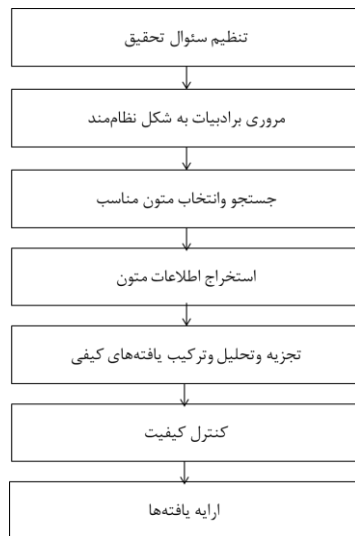
شکل ۱. مراحل اجرای روش فراترکیب

جامعه مورد بررسی در این پژوهش شامل همه پژوهش‌های انجام‌شده در حوزه عشق است. در مجموع ۲۱ پژوهش پذیرفته‌شده به کمک سامانه جست‌وجوی کتابخانه‌ها و پژوهشکده‌هایی مانند جهاد دانشگاهی (SID)، پایگاه نشریات کشور (magiran) و ایران‌داک (IranDoc) با کلمه ابعاد و انواع عشق در قسمت عنوان و محدود کردن جست‌وجو به زبان فارسی و محدوده سال‌های ۱۳۸۸-۱۴۰۰ به دست آمد. به دلیل محدودیت روش‌شناختی تنها پژوهش‌های کیفی بررسی شده‌اند. اطلاعات پژوهش‌های منتخب در جدول ۱ نشان داده شده است.