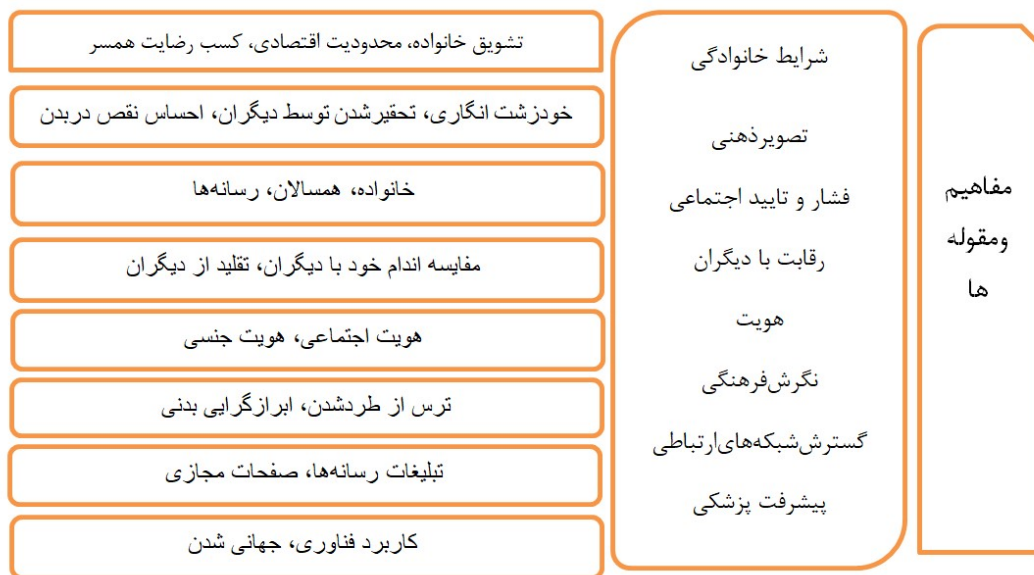
شکل ۳. مفاهیم و مقوله‌ها

«خانم ۳۸ ساله که کارمند می‌باشد برای مشاوره و تعیین وقت جراحی به بیمارستان مراجعه کرده بود بیان می‌کند: چاقی در من زمینه ژنتیکی داشته و زانوهایم پراتزی می‌باشد. ضربان قلبم بالا و فشارخون بالا نیز دارم. اخیراً کم کاری تیروئید دارم و قرص‌های ضد افسردگی استفاده می‌کنم. با پیشنهاد دکتر غدد و متخصص مغز و اعصاب به کلینیک آمده‌ام. سوخت و ساز بدنم پایین است کاهش وزن با راه‌کارهای دیگر بسیار سخت است. با شرکت در همایش‌های آقای دکتر و دنبال کردن صفحات مجازی دکتر و تحقیق درباره این جراحی، بهترین راه برای رسیدن به سلامتی را جراحی بای‌پس معده می‌بینم» (مصاحبه، آبان ۱۴۰۰).