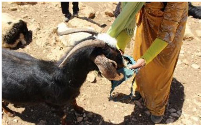
تصویر ۱۱. تصویری از کیسه لی سه

مردان و پسران خانواده نیز در هنگام شیردوشی به زنان و دختران کمک می‌کنند و دام‌ها را تا اتمام دوشیدن نگه می‌دارند و همچنین دام‌های خود را در میان گله پیدا کرده و آن‌ها را برای شیردوشی به جای مناسب می‌برند. در میان هورامی‌ها مرسوم است که معمولاً هر خانواده دام‌های خود را تا قبل از سن یک سالگی و قبل ورود آنها به گله با روش‌ها و علائم خاصی نشان گذاری می‌کنند تا در شناسایی دام خود در میان گله بزرگ دچار مشکل نشوند. بعضی از این شیوه و علائم نشانه گذاری به این صورت است: سوراخ کردن گوش دام، ایجاد نقوش و علامت بر روی گوش یا شاخ دام، استفاده از رنگ کردن شاخ دام، بستن پارچه رنگی به شاخ یا گوش سوراخ شده دام، آویزان کردن یک وسیله فلزی یا پارچه‌ای به گردن دام و غیره. یکی دیگر از روش‌های شناسایی و پیدا کردن دام‌ها از میان گله بزرگ، بهره‌گیری از صدا زدن‌ها و نام گذاری‌های خاصی است که به محض صدا زدن هر دام، آن بز یا گوسفند صدای صاحب خود را تشخیص داده و فوراً بع بع کنان به سمت صاحب خود می‌آید.