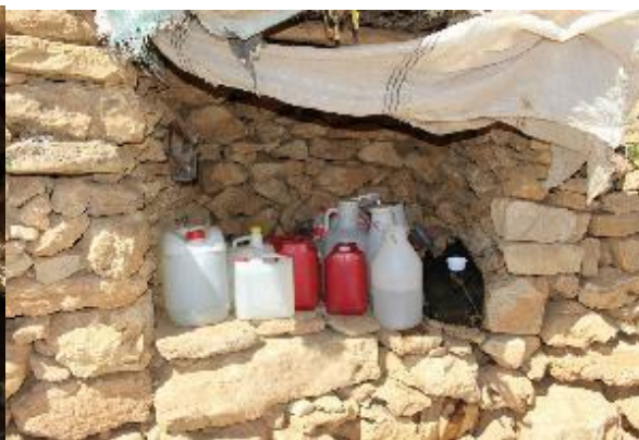
تصویر ۴. تصویری از قسمت کونه لان کپیر