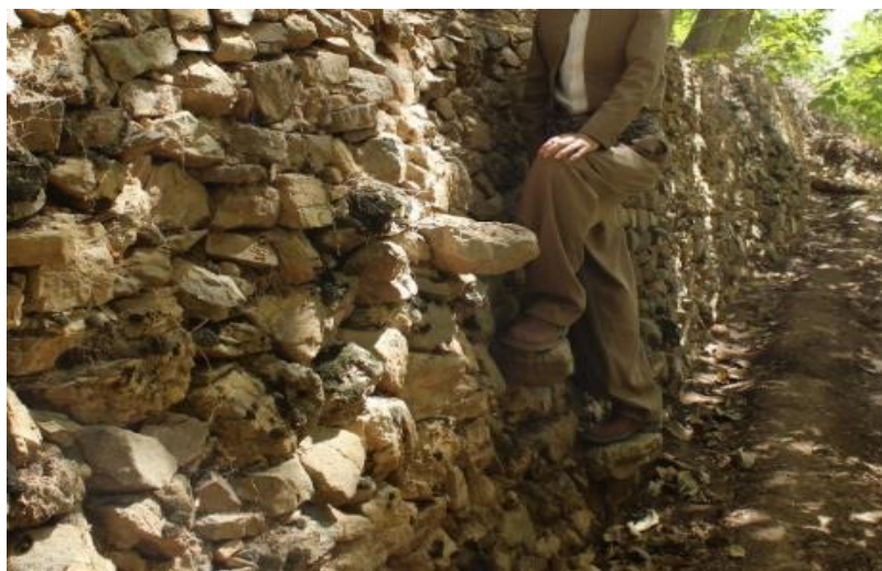
تصویر ۱۵. نمایی از پله برای دسترسی به تلان‌ها