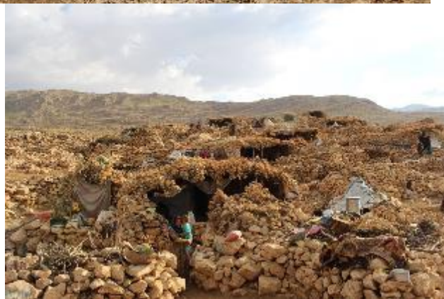
تصویر ۲. نمای از هوار هانیه، پالنگان، ارتفاعات شاهو

در میان هورامی‌ها، معمولاً چند روز قبل از جابجایی و کوچ کردن به هوار، تعدادی از اعضای خانواده به هوار رفته تا کلار را آماده سکونت کنند. بعد از آب و جارو کردن کلار، مقداری خاک سفید را از اطراف آورده و بعد آن را در آب قاطی نموده و بر کف کلار می‌مالند و سپس با یک سنگ سفید مخصوص که سطح صاف و همواری دارد و در اصطلاح محلی به آن «هیله سان» یا «سی ره کوله» می‌گویند، کاملاً خاک کف کلار را با این سنگ صاف و مسطح می‌کنند. که به این کار در اصطلاح محلی «کلار ناوی» می‌گویند. آنها سقف کلار را هم با چوب‌های بلند (در اصطلاح محلی به آن دَسک می‌گویند) و کوتاه (مروله) که به طور منظم بر روی دیوارهای کلار قرار می‌دهند، بازسازی می‌کنند. به این ترتیب که چوب بلند (دَسک) را در وسط قرار داده و چوب‌های کوتاه (مروله) را از یک طرف بر روی دیوار کپور و طرف دیگر آن بر روی دَسک قرار می‌دهند. در ادامه نایلونی یک دست و بزرگ روی چوب‌ها و سقف کلار قرار داده و روی آن را با شاخ و برگ درختان می‌پوشانند.