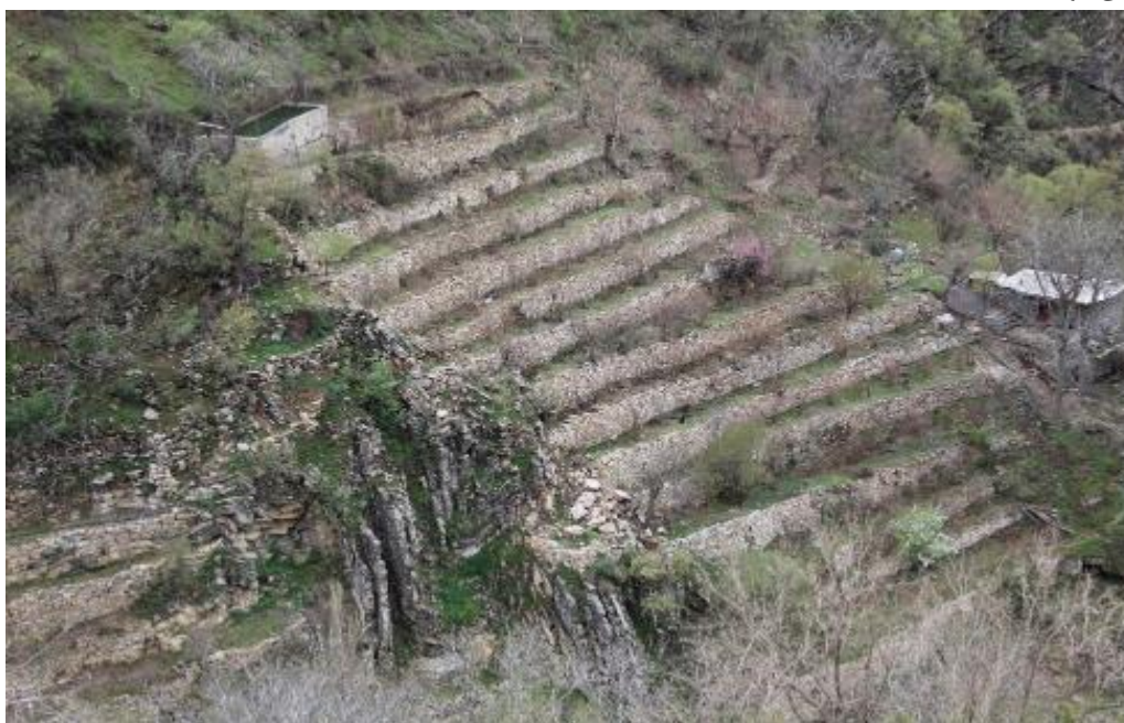
تصویر ۱۶. نمایی از تالان در هورامان

ارتفاع این تالان‌ها ۳ الی ۴ متر و معمولاً عرض شان از ۵ تا ۴۰ متر می‌باشد. در منطقه هورامان اگر این تالان‌ها پهنای کمی داشته باشند به آن «وچکله» wæčækLæ و اگر تالان‌ها در کنار رودخانه‌ها باشد و از پهنای بیشتری برخوردار باشند به آن «ته‌خته» tæxtæ گفته می‌شود.