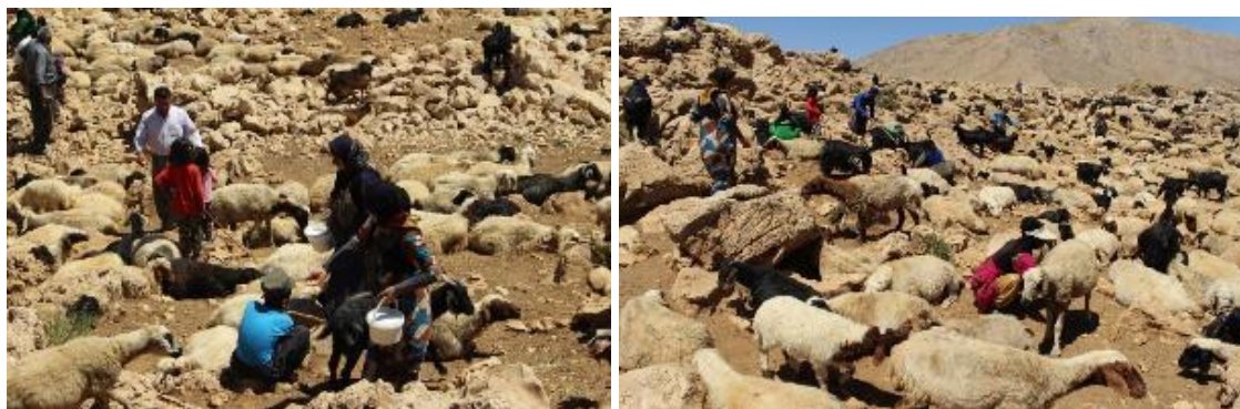
تصویر ۱۰. تصویری از بی ره گا

دادن به دام‌ها آنها را راهی محل استراحت و شیردوشی که در قسمت غرب هوار قرار دارد، می‌کنند. پس از نیم ساعت گله دومی گله به سر چشمه آمده و آنها نیز بعد از آب خوری راهی محل استراحت و شیر دوشی که در قسمت شرق هوار است، می‌شوند. یکی دیگر از دلایل تقسیم دام‌ها به دو گله این است که چون تعداد دام‌ها زیاد بوده، در هنگام شیردوشی شناسایی دام‌ها مشکل بوده و در نتیجه کسانی که در قسمت شرقی هوار زندگی می‌کنند دام‌های خود را به آن طرف و نزدیک کلاهای خود می‌آورند و کسانی هم که در قسمت غربی هوار زندگی می‌کنند دام‌های خود را به محل شیردوشی دام‌های خود در بخش غربی هوار می‌آورند. نکته قابل توجه این است که گله‌های دام متعلق به خانواده‌های هوار هانیه بعد از خوردن آب مسیر محل شیردوشی را در پیش می‌گیرند و هیچ گاه از مسیر همیشگی تخطی نمی‌کنند. به گفته مردم محلی حتی یک دام به اشتباه به جای دیگر نمی‌رود و همه آنها محل شیردوشی و صاحبان خود را می‌شناسند. مردم هوار پس از رسیدن دام‌ها و جمع شدن در محل استراحت و شیردوشی، همدیگر را با خبر می‌کنند و زنان و دختران و گاهی هم مردان خانواده با شور و شوق خاصی راهی محل استراحت دام‌ها که در اصطلاح محلی به آن «بی ره گا» می‌گویند می‌شوند. زنان و دخترانی که در امر شیردوشی مشارکت می‌کنند سطل‌ها و ظروف پلاستیکی کوچک را به همراه خود داشته و یک دبه بزرگ نیر برای جمع‌آوری شیر به همراه خود می‌برند.