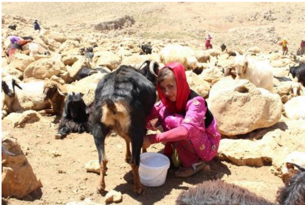
تصویر ۹. دختر هورامی در حال شیردوشی ارتفاعات شاهو

هر روز صبح زود زنان هوارنشین بعد از روشن شدن هوا و خواندن نماز صبح، گاوها را می‌دوشند و شیر آنها را جمع کرده و به کپر می‌آورند. سپس آنها را برای چریدن راهی دشت و صحرا می‌کنند و دیگر نیازی به چوپان ندارند و تا قبل غروب به محل هوار و کلارها برمی‌گردند. جالب این که همه دام‌ها و گاوها خودشان مسیر کلار صاحب خود را یاد گرفته و بدون هدایت صاحبان دام، راه خود را پیدا می‌کنند. تقریباً بیشتر خانواده‌ها هفت گاو و بعضی حتی تا پانزده گاو هم دارند. قبل از غروب آفتاب و به هنگام برگشتن گاو به هوارگه، زنان دوباره گاوها را می‌دوشند و به آنها آب و علف داده و آنها را راهی «که‌لار» شان می‌کنند تا در آن جا استراحت کنند. این روند در هوار همه روز تکرار می‌شود. در میان مردم اورامانات به بز و گوسفند در اصطلاح محلی «حیوانه ورده» می‌گویند. شیردوشی بز و گوسفند هم در طول روز در دو مرحله انجام می‌گیرد که در اصطلاح محلی به آن «گه له بی ری» می‌گویند. معمولاً چون تعداد بز و گوسفندها در هوار نسبت به گاوها بیشتر است و همچنین نگهداری از آنها در کنار کپر و محل سکونت میسر نیست، از این رو برای آن مدتی که مردم در هوار هستند چوپان به خدمت می‌گیرند. هر خانواده حدود هفتاد تا صد رأس بز و گوسفند دارند، تعداد دام‌های حال حاضر مردم هوار هانیه که متشکل از دو گله بزرگ است و تقریباً هرگله حدوداً شامل دو هزار رأس بوده و در نتیجه جمعاً چهار هزار رأس بز و گوسفند در هوار هانیه روستای پالنگان وجود دارد.