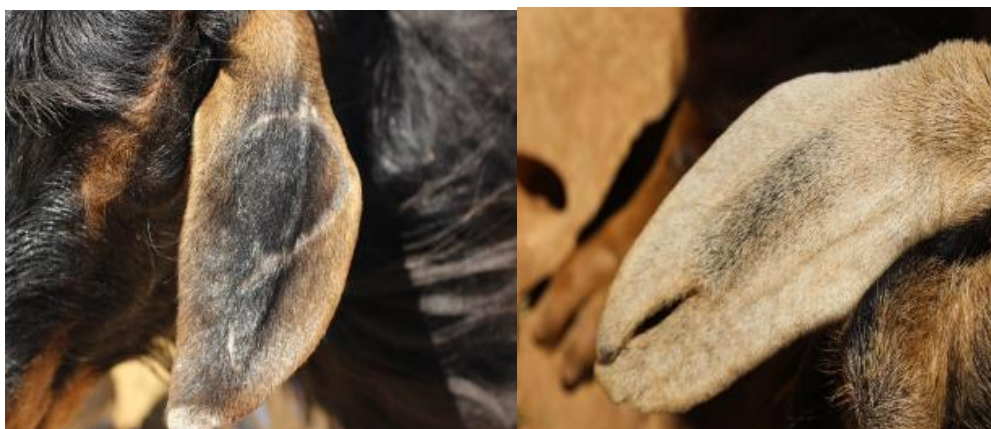
تصویر ۱۳. ایجاد نقش بر روی گوش گوسفندان

مردان و پسران خانواده نیز در هنگام شیردوشی به زنان و دختران کمک می‌کنند و دام‌ها را تا اتمام دوشیدن نگه می‌دارند و همچنین دام‌های خود را در میان گله پیدا کرده و آن‌ها را برای شیردوشی به جای مناسب می‌برند. در میان هورامی‌ها مرسوم است که معمولاً هر خانواده دام‌های خود را تا قبل از سن یک سالگی و قبل ورود آنها به گله با روش‌ها و علائم خاصی نشان گذاری می‌کنند تا در شناسایی دام خود در میان گله بزرگ دچار مشکل نشوند. بعضی از این شیوه و علائم نشانه گذاری به این صورت است: سوراخ کردن گوش دام، ایجاد نقوش و علامت بر روی گوش یا شاخ دام، استفاده از رنگ کردن شاخ دام، بستن پارچه رنگی به شاخ یا گوش سوراخ شده دام، آویزان کردن یک وسیله فلزی یا پارچه‌ای به گردن دام و غیره. یکی دیگر از روش‌های شناسایی و پیدا کردن دام‌ها از میان گله بزرگ، بهره‌گیری از صدا زدن‌ها و نام گذاری‌های خاصی است که به محض صدا زدن هر دام، آن بز یا گوسفند صدای صاحب خود را تشخیص داده و فوراً بع بع کنان به سمت صاحب خود می‌آید.