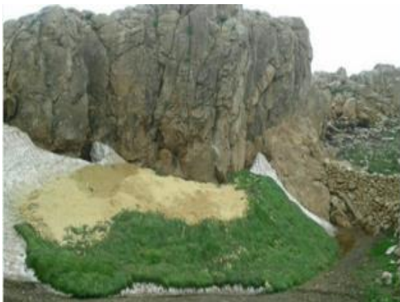
تصویر ۷. نمای از پرژین برف