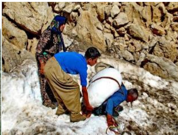
تصویر ۶. نمای از تامین برف از یخچال‌های طبیعی

تامین آب برای دام به شیوه دیگر انجام می‌گیرد و در اصطلاح محلی به پرژین برف یا همان پرچین برف معرف است در این شیوه روی برف‌های که کمتر در معرض نورخورشید قرار می‌گیرد با گیاهان خوشبو شاهی می‌پوشانند. در پایین دست برف‌ها یک ظرف چوبی به اسم «قَم» قرار می‌دهند قم وسیله‌ای چوبی است جهت نگهداری آب، قَم کُنده درختی است که وسط آن را خالی کرده و از آن جهت آبشخور دام استفاده می‌شود، آب برف پوشیده شده به مرور زمان قَم را پر می‌کند و دام‌ها از آن استفاده می‌شود. در فصل تابستان مردم هوار هانیه برای تأمین آب مورد نیاز خود مسافت زیادی را طی کرده تا به چشمه برسند. بعضی از خانواده‌ها که الاغ داشتند کار حمل دبه‌های آب برای آن‌ها آسان‌تر بود، آن‌ها با درست کردن باربندهایی در دو طرف الاغ در هر بار رفتن به چشمه می‌توانستند پنج تا شش دبه آب را همراه خود به خانه بیاورند. بعضی‌ها هم با «کونه» و بعضی دیگر نیز با دبه به چشمه می‌رفتند. به هر حال زنان و دختران در طی روز باید به طور متوسط سه تا چهار بار به چشمه بروند. با توجه به اینکه در هوار امکاناتی مانند یخچال و برق وجود ندارد، بنابراین هر وقت آب خنک بخواهند به چشمه می‌روند. در بعضی از ماه‌های سال ممکن است، ساکنان هوارگه با کمبود آب شرب مواجه شوند. برای رفع این مشکل ساکنان هوارگه اغلب در حوالی اردیبهشت در چاله‌ها و یا دالان‌های سنگی موجود در کوه‌ها، برف را ذخیره و با علفه کما آن را می‌پوشانند. ساکنان هوارگه با برش و حمل برف به هوارگه و آب کردن برف‌ها آب شرب خود را تامین می‌کنند.