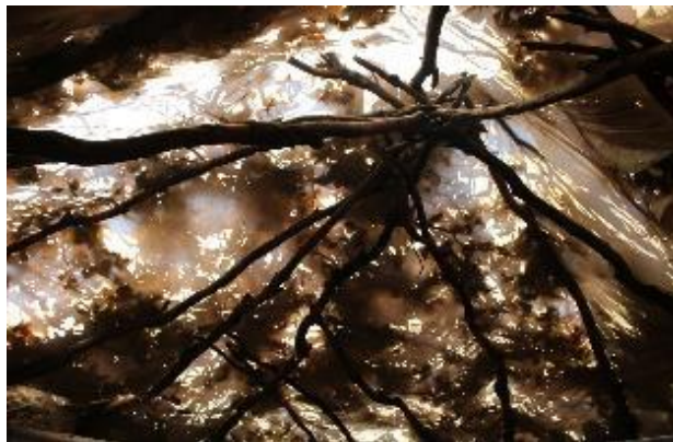
تصویر ۵. نمایی از سقف کپیر (د سگ و مروله)

به این ترتیب کم کم کپیر آماده سکونت می‌شود. معمولاً هر کدام از این کلارها متعلق به یک خانواده است و معمولاً از فضاهایی زیر تشکیل شده است: در ورودی؛ راهرو؛ «که لار» یا «په چه: محل نگهداری از گاو و الاغ؛ «کوزه»: محل نگهداری از بز و گوسفند؛ «کونه لان»: محل نگهداری مشکه و کونه؛ آشپزخانه (پانه چوه رینه)؛ انبار مواد غذایی (سکوی تیان و دغل و دان) و «تختان».