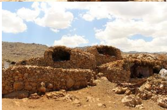
تصویر ۳. نمای ورودی کلارهای سنگی

به این ترتیب کم کم کپیر آماده سکونت می‌شود. معمولاً هر کدام از این کلارها متعلق به یک خانواده است و معمولاً از فضاهایی زیر تشکیل شده است: در ورودی؛ راهرو؛ «که لار» یا «په چه: محل نگهداری از گاو و الاغ؛ «کوزه»: محل نگهداری از بز و گوسفند؛ «کونه لان»: محل نگهداری مشکه و کونه؛ آشپزخانه (پانه چوه رینه)؛ انبار مواد غذایی (سکوی تیان و دغل و دان) و «تختان».