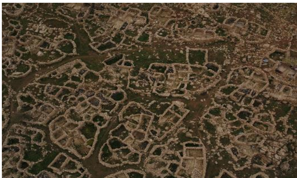
تصویر ۱. دورنمایی از هوار هانیه، ارتفاعات شاهو

معماری هوار در هوارنشینی شاهو (هوار هانیه) به صورت خشک چین و دایره‌ای شکل است، به این نوع مسکن در هورامان، «کلار» گفته می‌شود. هر ساله، این سازه‌ها از نو بازسازی می‌شوند. سقف آنها با گیاهان خوشبو شاهو پوشیده شده و بعد از پایان فصل هوارنشینی گیاهان خشک شده سقف جمع‌آوری و برای علوفه دام به روستاها حمل می‌شود.