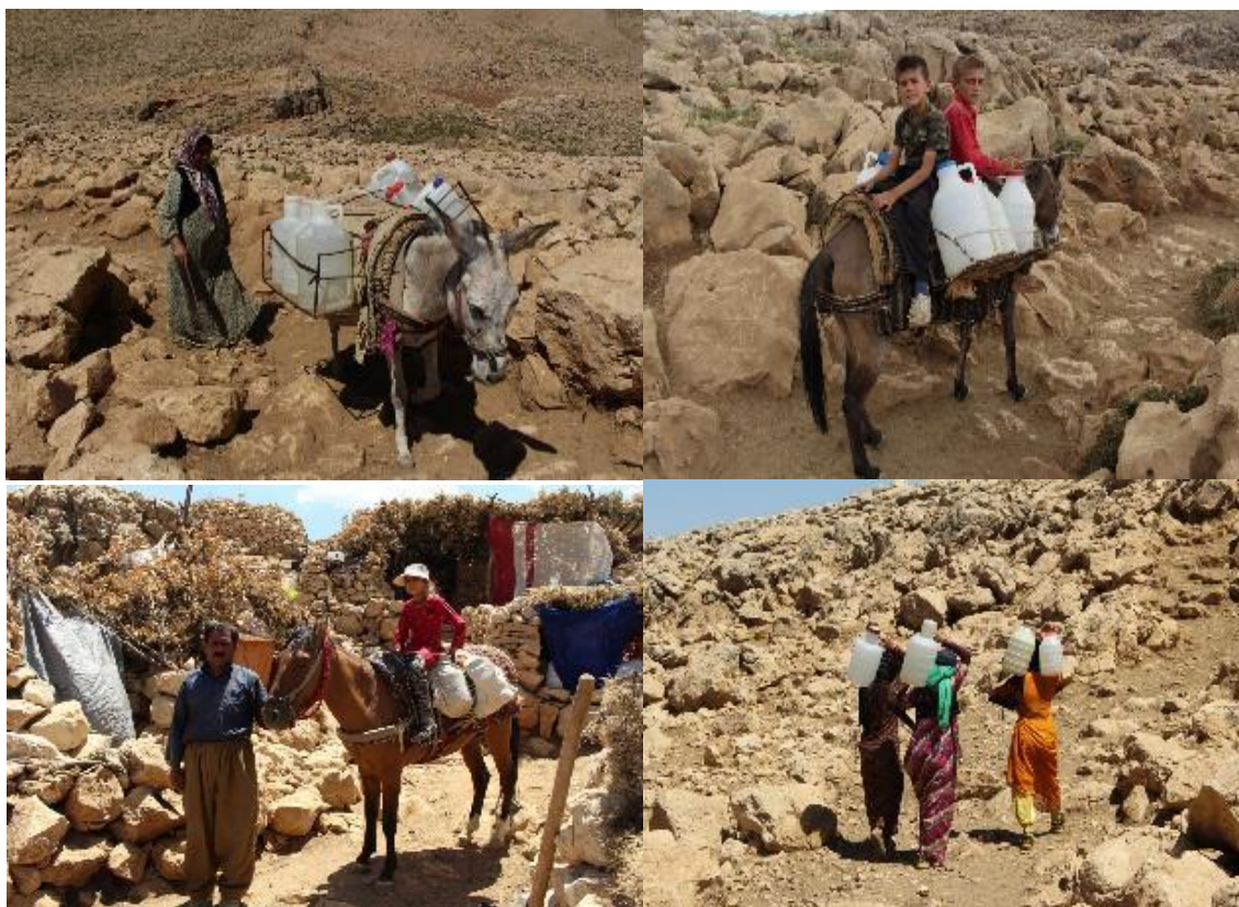
تصویر ۸. تامین آب مورد نیاز در فصل تابستان توسط هوارنشینان هانیه