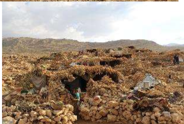
تصویر ۲. نمای از هوار هانیه، پالنگان، ارتفاعات شاهو

در میان هورامی‌ها، معمولاً چند روز قبل از جابجایی و کوچ کردن به هوار، تعدادی از اعضای خانواده به هوار رفته تا کلار را آماده سکونت کنند. بعد از آب و جارو کردن کلار، مقداری خاک سفید را از اطراف آورده و بعد آن را در آب قاطی نموده و بر کف کلار می‌مالند و سپس با یک سنگ سفید مخصوص که سطح صاف و همواری دارد و در اصطلاح محلی به آن «هیله سان» یا «سی ره کوله» می‌گویند، کاملاً خاک کف کلار را با این سنگ صاف و مسطح می‌کنند. که به این کار در اصطلاح محلی «کلار ناوی» می‌گویند. آنها سقف کلار را هم با چوب‌های بلند (در اصطلاح محلی به آن دَسک می‌گویند) و کوتاه (مروله) که به طور منظم بر روی دیوارهای کلار قرار می‌دهند، بازسازی می‌کنند. به این ترتیب که چوب بلند (دَسک) را در وسط قرار داده و چوب‌های کوتاه (مروله) را از یک طرف بر روی دیوار کپور و طرف دیگر آن بر روی دَسک قرار می‌دهند. در ادامه نایلونی یک دست و بزرگ روی چوب‌ها و سقف کلار قرار داده و روی آن را با شاخ و برگ درختان می‌پوشانند.