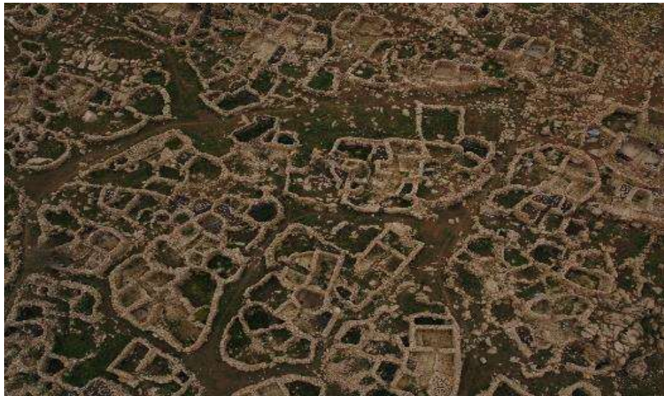
تصویر ۱. دورنمایی از هوار هانیه، ارتفاعات شاهو

معماری هوار در هوارنشینی شاهو (هوار هانیه) به صورت خشک چین و دایره‌ای شکل است، به این نوع مسکن در هورامان، «کلار» گفته می‌شود. هر ساله، این سازه‌ها از نو بازسازی می‌شوند. سقف آنها با گیاهان خوشبو شاهو پوشیده شده و بعد از پایان فصل هوارنشینی گیاهان خشک شده سقف جمع‌آوری و برای علوفه دام به روستاها حمل می‌شود.