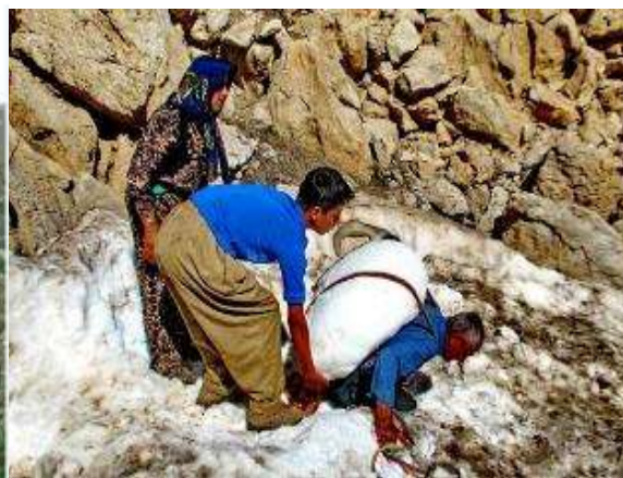
تصویر ۶. نمای از تامین برف از یخچال‌های طبیعی

تامین آب برای دام به شیوه دیگر انجام می‌گیرد و در اصطلاح محلی به پرژین برف یا همان پرچین برف معرف است در این شیوه روی برف‌های که کمتر در معرض نورخورشید قرار می‌گیرد با گیاهان خوشبو شاهی می‌پوشانند. در پایین دست برف‌ها یک ظرف چوبی به اسم «قَم» قرار می‌دهند قم وسیله‌ای چوبی است جهت نگهداری آب، قَم کُنده درختی است که وسط آن را خالی کرده و از آن جهت آبشخور دام استفاده می‌شود، آب برف پوشیده شده به مرور زمان قَم را پر می‌کند و دام‌ها از آن استفاده می‌شود. در فصل تابستان مردم هوار هانیه برای تأمین آب مورد نیاز خود مسافت زیادی را طی کرده تا به چشمه برسند. بعضی از خانواده‌ها که الاغ داشتند کار حمل دبه‌های آب برای آن‌ها آسان‌تر بود، آن‌ها با درست کردن بارندهایی در دو طرف الاغ در هر بار رفتن به چشمه می‌توانستند پنج تا شش دبه آب را همراه خود به خانه بیاورند. بعضی‌ها هم با «کونه» و بعضی دیگر نیز با دبه به چشمه می‌رفتند. به هر حال زنان و دختران در طی روز باید به طور متوسط سه تا چهار بار به چشمه بروند. با توجه به اینکه در هوار امکاناتی مانند یخچال و برق وجود ندارد، بنابراین هر وقت آب خنک بخواهند به چشمه می‌روند. در بعضی از ماه‌های سال ممکن است، ساکنان هوارگه با کمبود آب شرب مواجه شوند. برای رفع این مشکل ساکنان هوارگه اغلب در حوالی اردیبهشت در چاله‌ها و یا دالان‌های سنگی موجود در کوه‌ها، برف را ذخیره و با علفه کما آن را می‌پوشانند. ساکنان هوارگه با برش و حمل برف به هوارگه و آب کردن برف‌ها آب شرب خود را تامین می‌کنند.