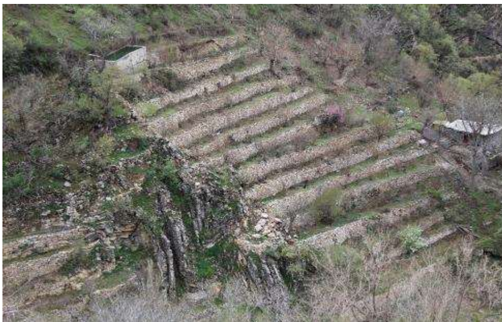
تصویر ۱۶. نمایی از تالان در هورامان

ارتفاع این تالان‌ها ۳ الی ۴ متر و معمولاً عرض شان از ۵ تا ۴۰ متر می‌باشد. در منطقه هورامان اگر این تالان‌ها پهنای کمی داشته باشند به آن «وچکله wæčækLæ » و اگر تالان‌ها در کنار رودخانه‌ها باشد و از پهنای بیشتری برخوردار باشند به آن «ته‌خته tæxtæ » گفته می‌شود.