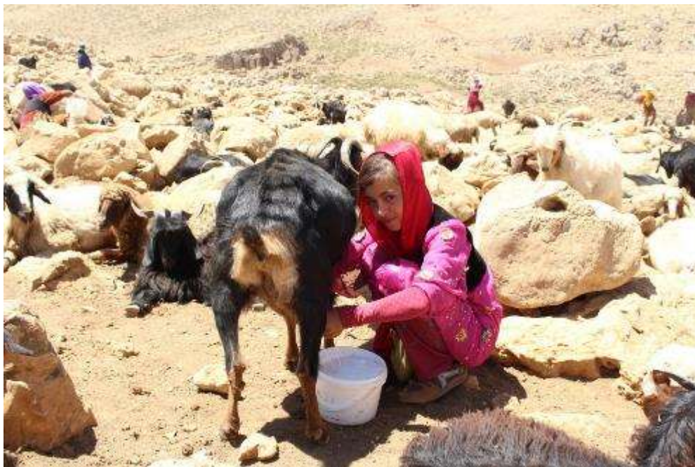
تصویر ۹. دختر هورامی در حال شیردوشی ارتفاعات شاهو

هر روز صبح زود زنان هوازنشین بعد از روشن شدن هوا و خواندن نماز صبح، گاوها را می‌دوشند و شیر آنها را جمع کرده و به کپر می‌آورند. سپس آنها را برای چریدن راهی دشت و صحرا می‌کنند و دیگر نیازی به چوپان ندارند و تا قبل غروب به محل هوار و کلارها برمی‌گردند. جالب این که همه دامها و گاوها خودشان مسیر کلار صاحب خود را یاد گرفته و بدون هدایت صاحبان دام، راه خود را پیدا می‌کنند. تقریباً بیشتر خانواده‌ها هفت گاو و بعضی حتی تا پانزده گاو هم دارند. قبل از غروب آفتاب و به هنگام برگشتن گاو به هوارگه، زنان دوباره گاوها را می‌دوشند و به آنها آب و علف داده و آنها را راهی «که‌لار» شان می‌کنند تا در آن جا استراحت کنند. این روند در هوار همه روز تکرار می‌شود. در میان مردم اورامانات به بز و گوسفند در اصطلاح محلی «حیوانه ورده» می‌گویند. شیردوشی بز و گوسفند هم در طول روز در دو مرحله انجام می‌گیرد که در اصطلاح محلی به آن «گه له بی ری» می‌گویند. معمولاً چون تعداد بز و گوسفندها در هوار نسبت به گاوها بیشتر است و همچنین نگهداری از آنها در کنار کپر و محل سکونت میسر نیست، از این رو برای آن مدتی که مردم در هوار هستند چوپان به خدمت می‌گیرند. هر خانواده حدود هفتاد تا صد رأس بز و گوسفند دارند، تعداد دامهای حال حاضر مردم هوار هانیه که متشکل از دو گله بزرگ است و تقریباً هرگله حدوداً شامل دو هزار رأس بوده و در نتیجه جمعاً چهار هزار رأس بز و گوسفند در هوار هانیه روستای پالنگان وجود دارد.