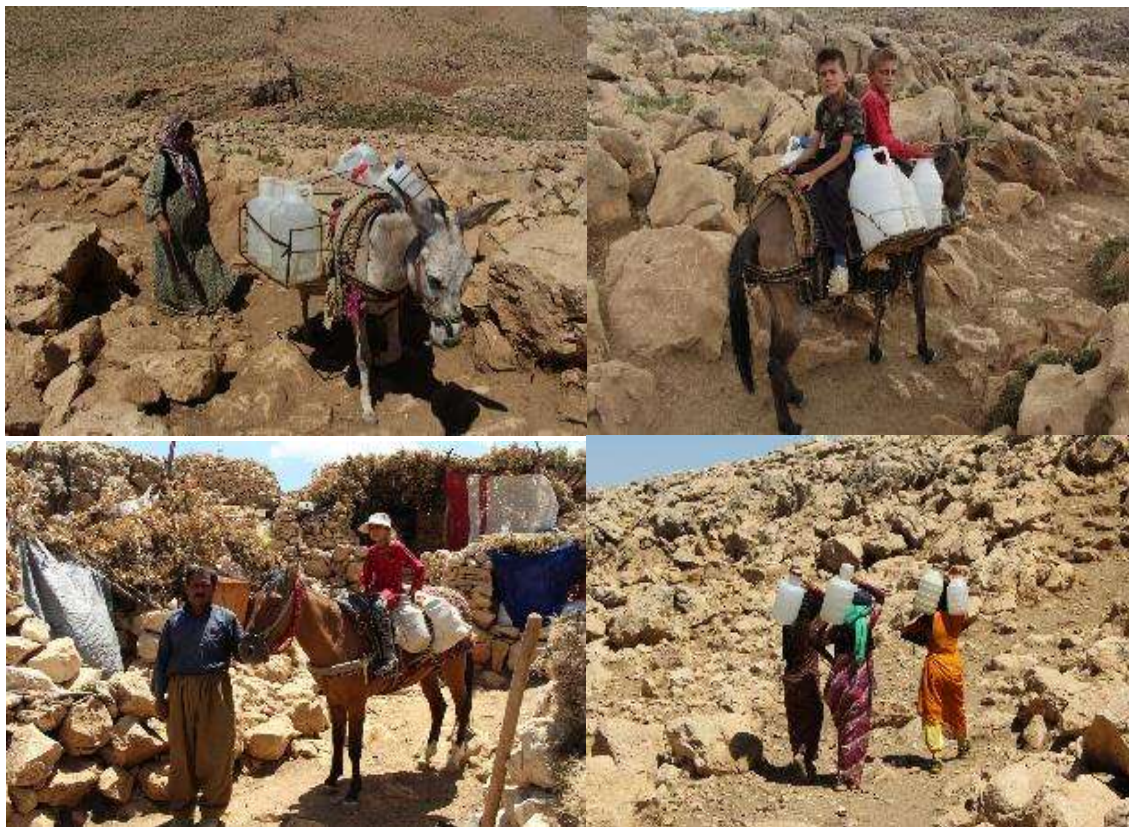
تصویر ۸. تامین آب مورد نیاز در فصل تابستان توسط هوارنشینان هانیه