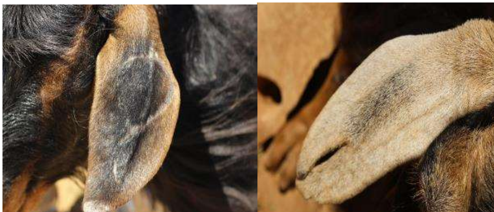
تصویر ۱۳. ایجاد نقش بر روی گوش گوسفندان

مردان و پسران خانواده نیز در هنگام شیردوشی به زنان و دختران کمک می‌کنند و دام‌ها را تا اتمام دوشیدن نگه می‌دارند و همچنین دام‌های خود را در میان گله پیدا کرده و آن‌ها را برای شیردوشی به جای مناسب می‌برند. در میان هورامی‌ها مرسوم است که معمولاً هر خانواده دام‌های خود را تا قبل از سن یک سالگی و قبل ورود آنها به گله با روش‌ها و علائم خاصی نشان گذاری می‌کنند تا در شناسایی دام خود در میان گله بزرگ دچار مشکل نشوند. بعضی از این شیوه و علائم نشانه گذاری به این صورت است: سوراخ کردن گوش دام، ایجاد نقوش و علامت بر روی گوش یا شاخ دام، استفاده از رنگ کردن شاخ دام، بستن پارچه رنگی به شاخ یا گوش سوراخ شده دام، آویزان کردن یک وسیله فلزی یا پارچه‌ای به گردن دام و غیره. یکی دیگر از روش‌های شناسایی و پیدا کردن دام‌ها از میان گله بزرگ، بهره‌گیری از صدا زدن‌ها و نام گذاری‌های خاصی است که به محض صدا زدن هر دام، آن بز یا گوسفند صدای صاحب خود را تشخیص داده و فوراً بع بع کنان به سمت صاحب خود می‌آید.