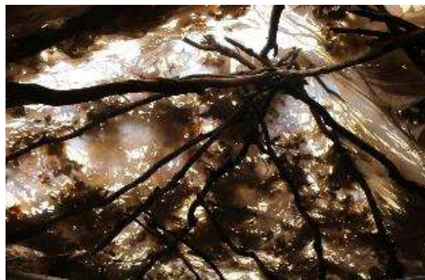
تصویر ۵. نمایی از سقف کپر (د سگ و مروله)

به این ترتیب کم کم کپر آماده سکونت می‌شود. معمولاً هر کدام از این کلارها متعلق به یک خانواده است و معمولاً از فضاهایی زیر تشکیل شده است: در ورودی؛ راهرو؛ «که لار» یا «په چه: محل نگهداری از گاو و الاغ؛ «کوزه»: محل نگهداری از بز و گوسفند؛ «کونه لان»: محل نگهداری مشکه و کونه؛ آشپزخانه (پانه چوه رینه)؛ انبار مواد غذایی (سکوی تیان و دغل و دان) و «تختان».