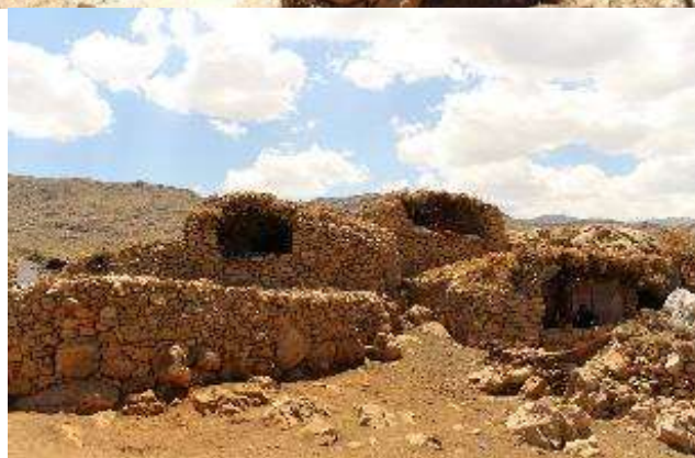
تصویر ۳. نمای ورودی کلارهای سنگی

به این ترتیب کم کم کپر آماده سکونت می‌شود. معمولاً هر کدام از این کلارها متعلق به یک خانواده است و معمولاً از فضاهایی زیر تشکیل شده است: در ورودی؛ راهرو؛ «که لار» یا «په چه: محل نگهداری از گاو و الاغ؛ «کوزه»: محل نگهداری از بز و گوسفند؛ «کونه لان»: محل نگهداری مشکه و کونه؛ آشپزخانه (پانه چوه رینه)؛ انبار مواد غذایی (سکوی تیان و دغل و دان) و «تختان».