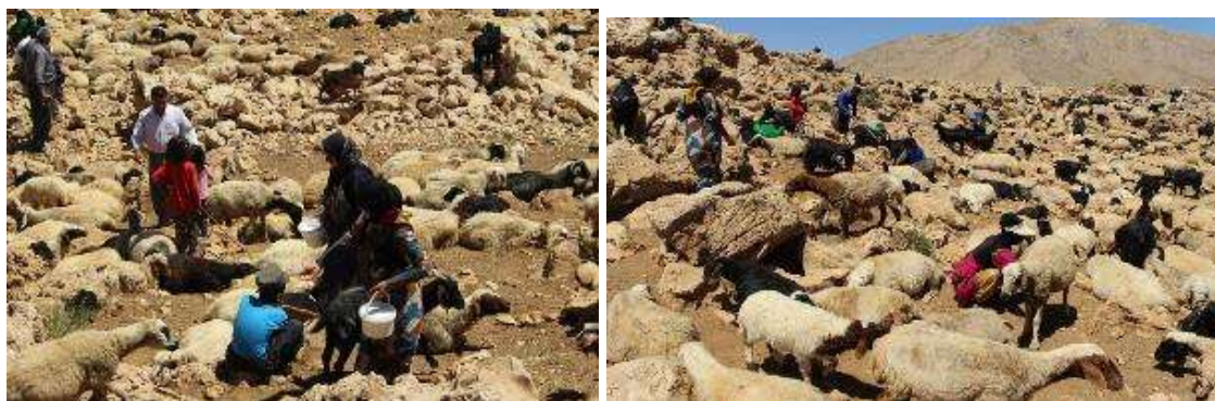
تصویر ۱۰. تصویری از بی ره گا

دادن به دام‌ها آنها را راهی محل استراحت و شیردوشی که در قسمت غرب هوار قرار دارد، می‌کنند. پس از نیم ساعت گله دومی گله به سر چشمه آمده و آنها نیز بعد از آب خوری راهی محل استراحت و شیر دوشی که در قسمت شرق هوار است، می‌شوند. یکی دیگر از دلایل تقسیم دام‌ها به دو گله این است که چون تعداد دام‌ها زیاد بوده، در هنگام شیردوشی شناسایی دام‌ها مشکل بوده و در نتیجه کسانی که در قسمت شرقی هوار زندگی می‌کنند دام‌های خود را به آن طرف و نزدیک کلاهای خود می‌آورند و کسانی هم که در قسمت غربی هوار زندگی می‌کنند دام‌های خود را به محل شیردوشی دام‌های خود در بخش غربی هوار می‌آورند. نکته قابل توجه این است که گله‌های دام متعلق به خانواده‌های هوار هانیه بعد از خوردن آب مسیر محل شیردوشی را در پیش می‌گیرند و هیچ گاه از مسیر همیشگی تخطی نمی‌کنند. به گفته مردم محلی حتی یک دام به اشتباه به جای دیگر نمی‌رود و همه آنها محل شیردوشی و صاحبان خود را می‌شناسند. مردم هوار پس از رسیدن دام‌ها و جمع شدن در محل استراحت و شیردوشی، همدیگر را با خبر می‌کنند و زنان و دختران و گاهی هم مردان خانواده با شور و شوق خاصی راهی محل استراحت دام‌ها که در اصطلاح محلی به آن «بی ره گا» می‌گویند می‌شوند. زنان و دخترانی که در امر شیردوشی مشارکت می‌کنند سطل‌ها و ظروف پلاستیکی کوچک را به همراه خود داشته و یک دبه بزرگ نیر برای جمع‌آوری شیر به همراه خود می‌برند.