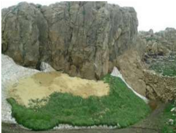
تصویر ۷. نمای از پرژین برف