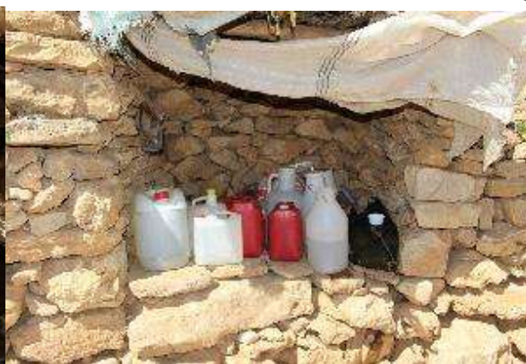
تصویر ۴. تصویری از قسمت کونه لان کپر