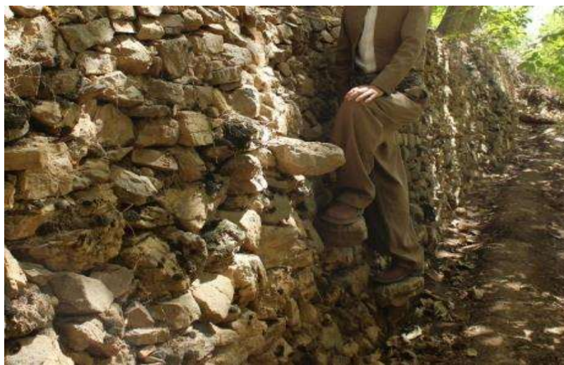
تصویر ۱۵. نمایی از پله برای دسترسی به تلان‌ها