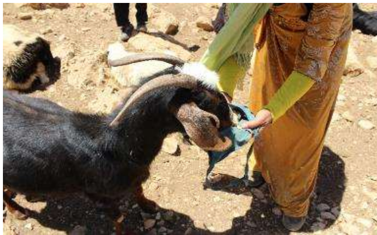
تصویر ۱۱. تصویری از کیسه لی سه

مردان و پسران خانواده نیز در هنگام شیردوشی به زنان و دختران کمک می‌کنند و دام‌ها را تا اتمام دوشیدن نگه می‌دارند و همچنین دام‌های خود را در میان گله پیدا کرده و آن‌ها را برای شیردوشی به جای مناسب می‌برند. در میان هورامی‌ها مرسوم است که معمولاً هر خانواده دام‌های خود را تا قبل از سن یک سالگی و قبل ورود آنها به گله با روش‌ها و علائم خاصی نشان گذاری می‌کنند تا در شناسایی دام خود در میان گله بزرگ دچار مشکل نشوند. بعضی از این شیوه و علائم نشانه گذاری به این صورت است: سوراخ کردن گوش دام، ایجاد نقوش و علامت بر روی گوش یا شاخ دام، استفاده از رنگ کردن شاخ دام، بستن پارچه رنگی به شاخ یا گوش سوراخ شده دام، آویزان کردن یک وسیله فلزی یا پارچه‌ای به گردن دام و غیره. یکی دیگر از روش‌های شناسایی و پیدا کردن دام‌ها از میان گله بزرگ، بهره‌گیری از صدا زدن‌ها و نام گذاری‌های خاصی است که به محض صدا زدن هر دام، آن بز یا گوسفند صدای صاحب خود را تشخیص داده و فوراً بع بع کنان به سمت صاحب خود می‌آید.