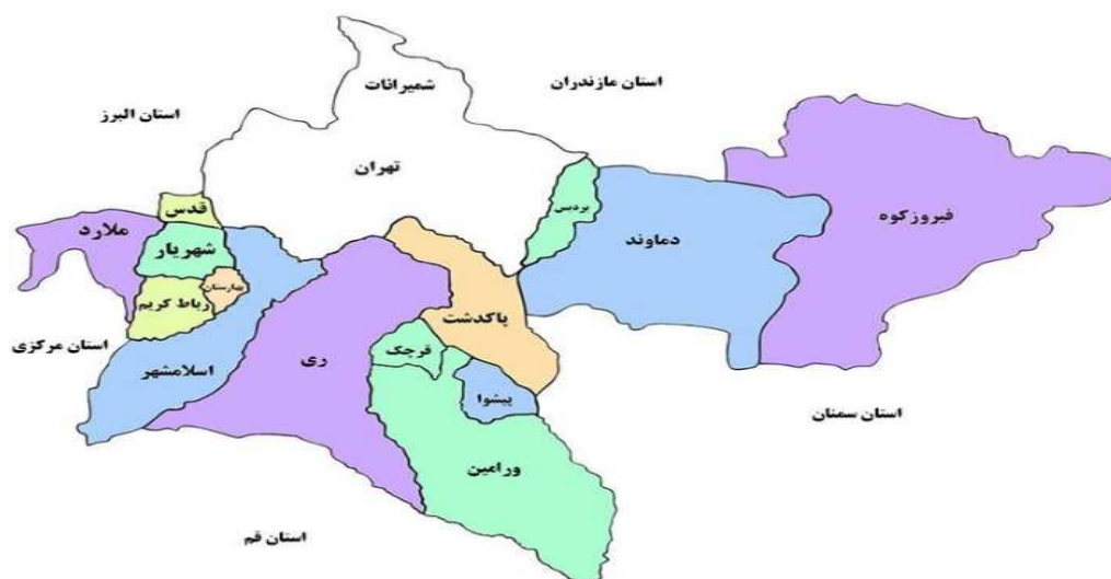
شکل ۱. میدان مطالعه

میدان اصلی پژوهش حاضر، منطقه اسکان غیررسمی شهرک عزیزی در شهر قدس (قلعه حسن خان) می‌باشد. شهر قدس از شرق و شمال شرقی به شهر تهران، از غرب و جنوب غربی به شهرستان شهریار و از شمال و شمال غربی به شهر کرج محدود می‌شود. به لحاظ ارتباطات و بعد مسافت، شهر قدس کمترین فاصله را در میان شهرهای استان تهران با کلان‌شهر تهران ۱۸ کیلومتر دارد (شریفی و چپوائی، ۱۳۹۶: ۲۹).